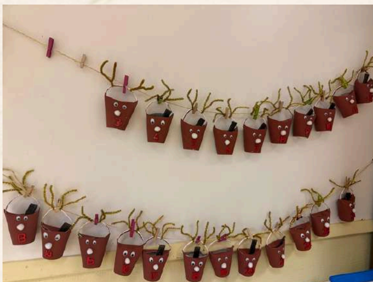
Le calendrier de l'Avent des MS : le décompte a commencé