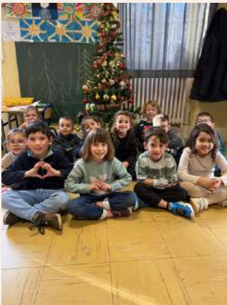
Décoration du sapin de Noël