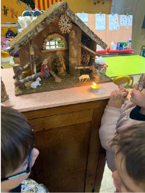
Installation de la crèche en attendant Noël