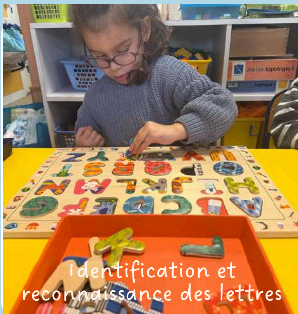
Identification et reconnaissance des lettres