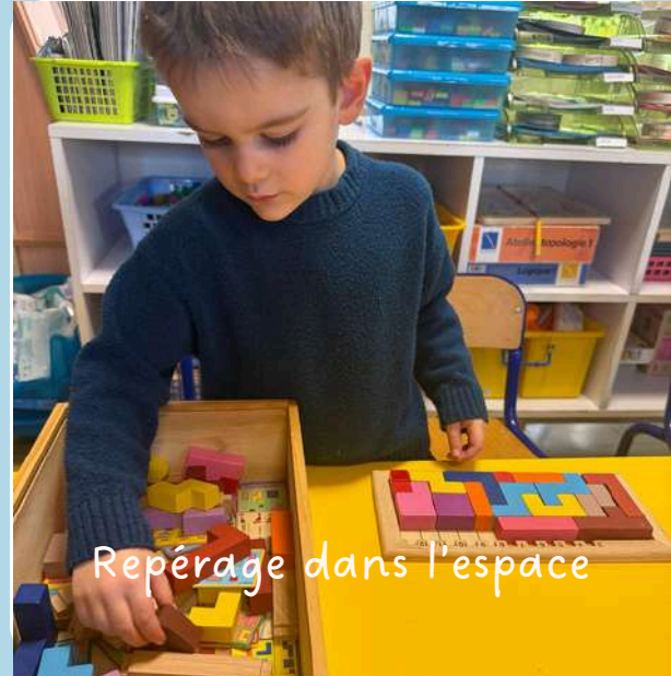
Repérage dans l'espace