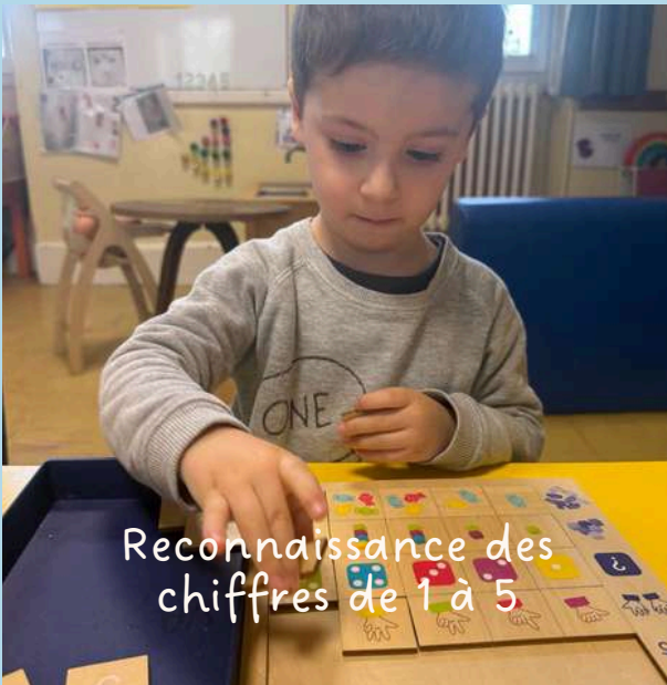
Reconnaissance des chiffres de 1 à 5