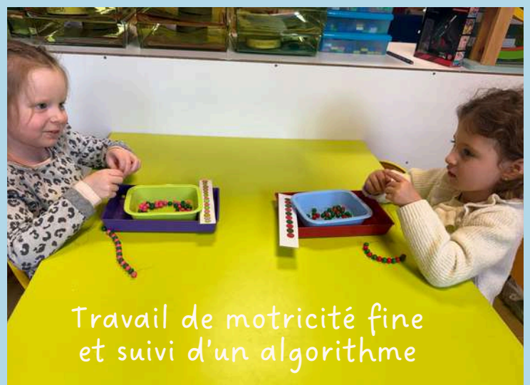
Travail de motricité fine et suivi d'un algorithme