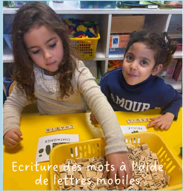
Ecriture des mots à l'aide de lettres mobiles