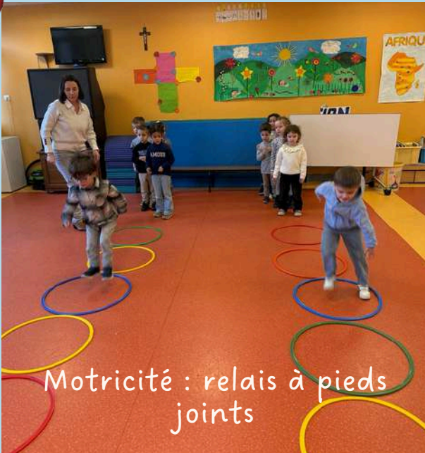
Motricité : relais à pieds joints